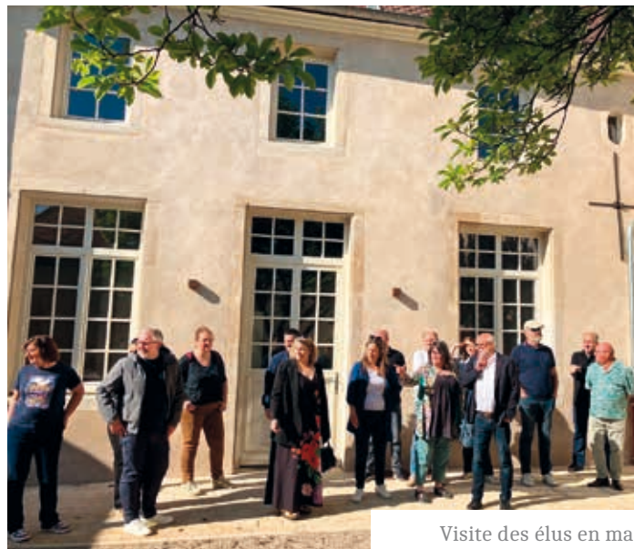
Visite des élus en mai

Il reste à présent à poursuivre avec la finition des menuiseries, dont la porte intérieure et celle de la grange ainsi que les aménagements extérieurs côté jardin. Trames minérales et végétales composeront cet espace qui, à terme, se posera en un remarquable belvédère doté d'une imprenable vue sur la boucle de la Moselle.