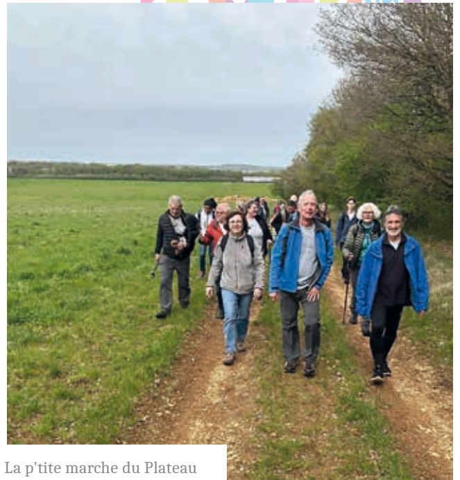
La p'tite marche du Plateau

Pour les vacances d'avril, le succès a été au rendez vous : une trentaine d'enfants ont participé à une grande chasse aux œufs, pensée pour les petits comme pour les plus grands. L'enthousiasme était tel qu'une seconde session a dû être improvisée par les organisatrices ! Côté association, Cyclaneuf était présent pour présenter ses actions et échanger avec les familles. Prochain RDV le 3 juillet à partir de 16h30 à l'Espace Mozart pour célébrer les grandes vacances dans l'esprit d'une fête foraine.