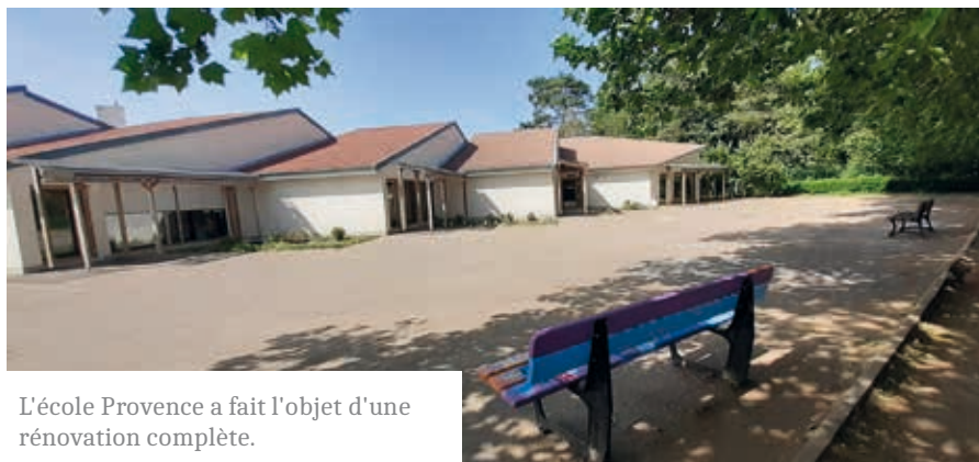
L'école Provence a fait l'objet d'une rénovation complète.

L'année 2022 a été marquée par une crise énergétique sans précédent, conjuguant hausse brutale des coûts et incertitudes sur l'approvisionnement en gaz. Dans ce contexte, la commune a fait le choix d'agir rapidement et durablement, en engageant un programme ambitieux de réduction des consommations énergétiques.