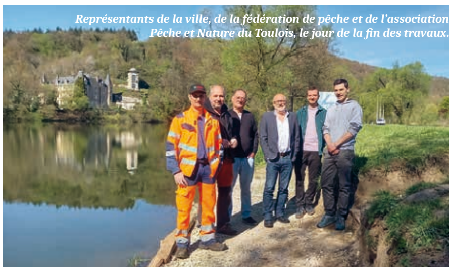
Représentants de la ville, de la fédération de pêche et de l'association Pêche et Nature du Toulais, le jour de la fin des travaux.

Ces aménagements ont été réalisés par le service espaces verts de la ville de Liverdun. Nous les utiliserons cet été pour les initiations « pêchez en famille » qui sont toujours des moments appréciés de tous.