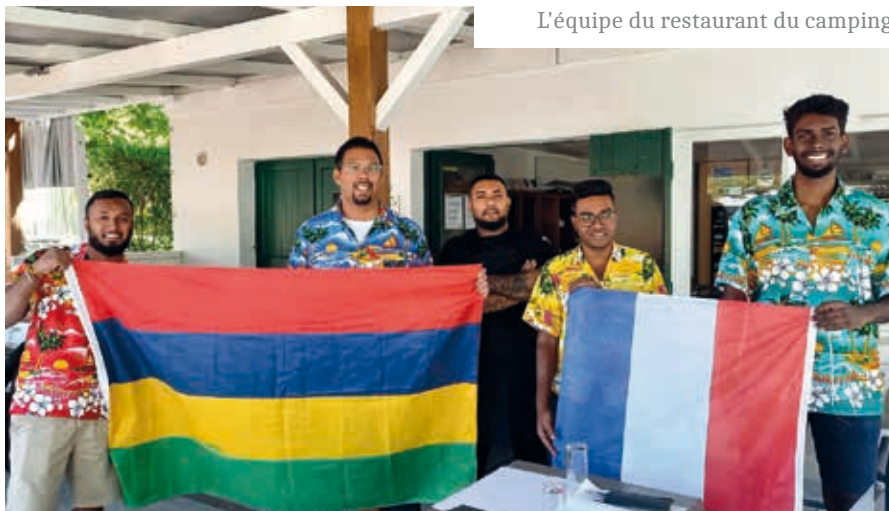
L'équipe du restaurant du camping.

Une touche exotique que l'on retrouve jusque dans les uniformes colorés des serveurs en salle.