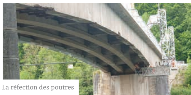
La réfection des poutres