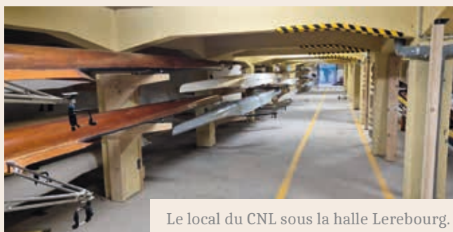
Le local du CNL sous la halle Lerebourg.

L'aménagement de Lerebourg est totalement achevé depuis l'emménagement du Cercle Nautique Liverdunois (CNL) au printemps. Le club dispose de 800 m 2 sous la halle pour ranger son matériel, d'une rampe d'accès au local qui mène facilement au ponton redéplacé pour la pratique des rameurs. Les travaux du bâtiment par la commune et ses partenaires financiers ont été complétés par les aménagements intérieurs réalisés par les membres du club sur plusieurs mois (soutenus par une subvention municipale exceptionnelle). Le club bénéficie désormais d'un très bel outil pour ses activités sur la boucle de la Moselle.