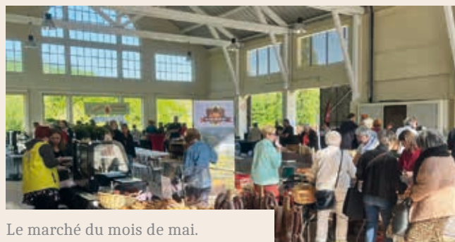
Le marché du mois de mai.

Distribution les 28 et 29 août de 9h00 à 12h00 à l'Espace Loisirs Champagne.