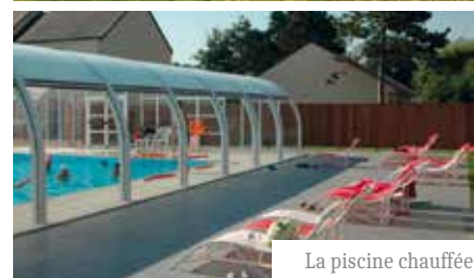
La piscine chauffée

À seulement quelques pas de la plage, le village de vacances Les Tourelles offre un cadre privilégié pour une escapade placée sous le signe de la détente, de la découverte et du charme normand. À 50 mètres du bord de mer, ce site exceptionnel bénéficie d'un emplacement stratégique, au cœur même des célèbres plages du Débarquement. Bien plus qu'un hébergement : c'est une immersion dans une Normandie attachante, riche de paysages variés, d'histoire et de convivialité. Entre détente et culture, ce séjour promet une escapade inoubliable au rythme des marées et de l'héritage normand.