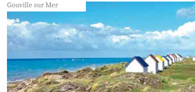
Gouville sur Mer