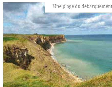
Une plage du débarquement