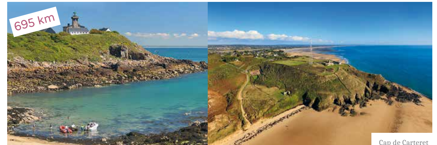
Cap de Carteret