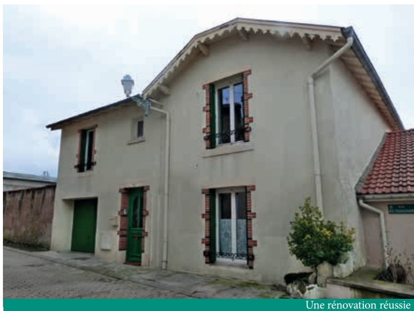
Une rénovation réussie