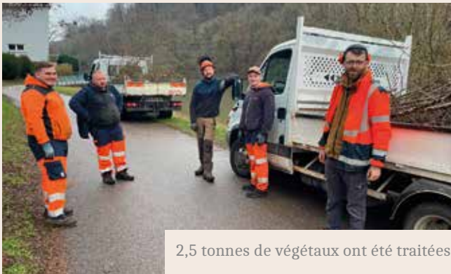
2,5 tonnes de végétaux ont été traitées

Été comme hiver, il y a de quoi faire aux espaces verts. Souvent par des conditions météo difficiles, toute l'équipe des espaces verts façonne nos espaces naturels tant appréciés sur Liverdun. Nombreux sont les promeneurs, qu'ils soient piétons, cyclistes, ou motorisés, qui apprécient la vue le long du bord de la Moselle.