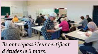
Ils ont repassé leur certificat d'études le 3 mars.

Parlez de votre vécu à Liverdun Mardi 5 mai à 14h au Château Corbin Partagez vos souvenirs, vos expériences dans un moment bienveillant. Ensemble, faisons vivre la mémoire de Liverdun.