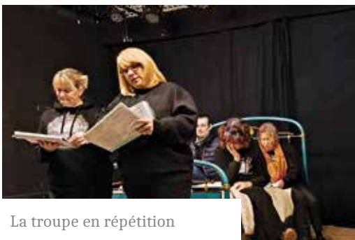
La troupe en répétition

Tarifs : 10 € / 5 € / gratuit pour - de 12 ans