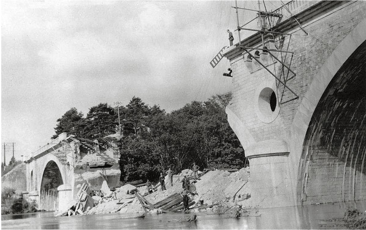
Le pont SNCF près de l'usine Lerebourg