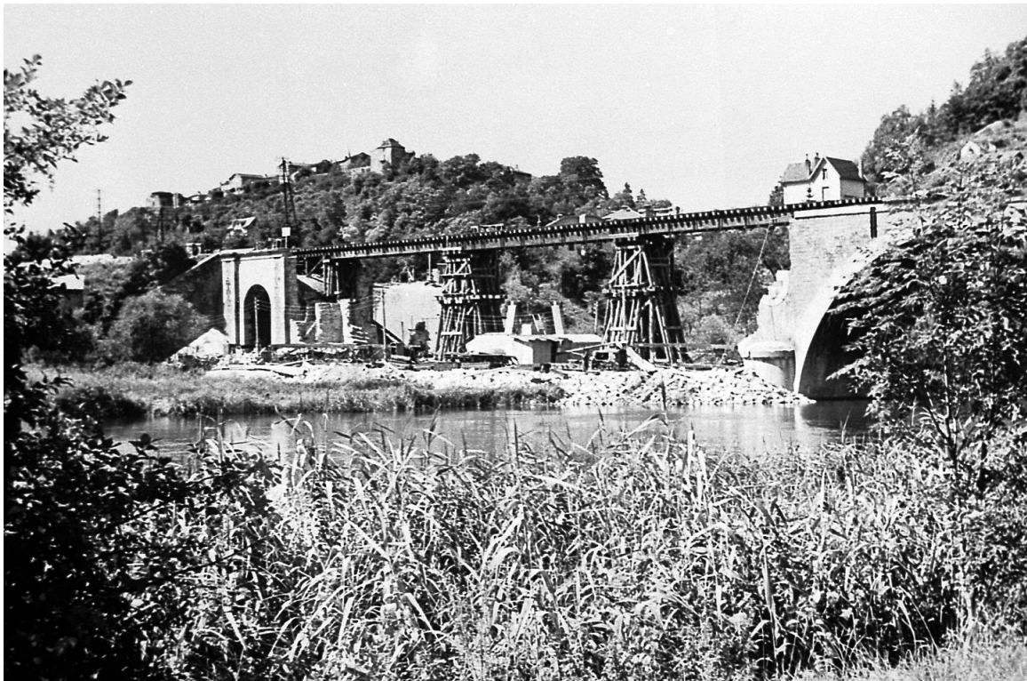
Le pont SNCF vers Frouard